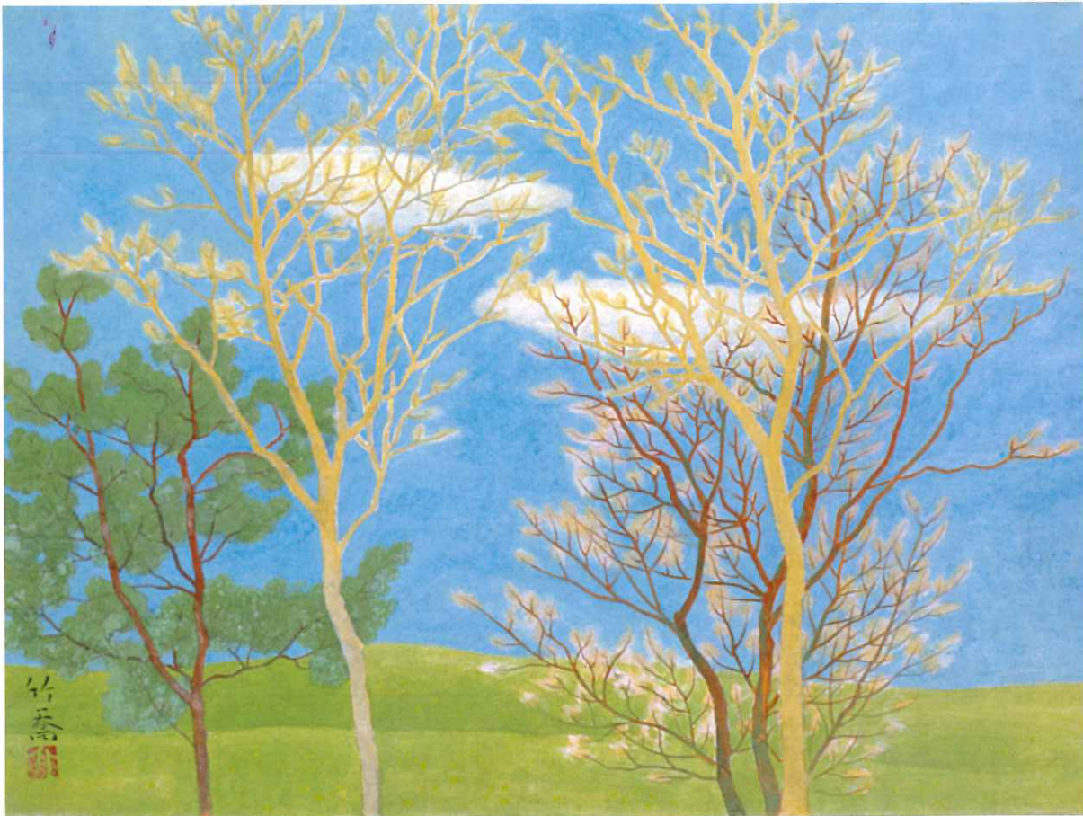
小野竹喬 作「春」 笠岡市立竹喬美術館蔵